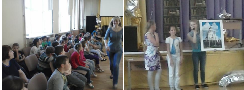
Началась программа... Команда «Россия» выигрывает первый конкурс «Строим здание». И первый ключ наш!

11.00 – 12.00 – Общелагерное командное мероприятие «Культура России». Мероприятие проводил выездной театр «Разиня». Игровая программа состояла из 7 конкурсов, в которых участвовало 2 команды. Отряд «Звезды» принимал активное участие во всех конкурсных играх в составе команды «Россия». Счет между командами менялся, игра была напряженной, интересной и познавательной. Во время игры ребята стали и архитекторами, и музыкантами, и скульпторами, и живописцами, и поэтами.