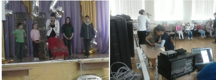
Конкурс на запоминание. Память надо развивать! «Ваятели». Создаем скульптуру Чебурашки!