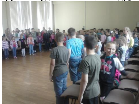
Поем гимн Российской Федерации!