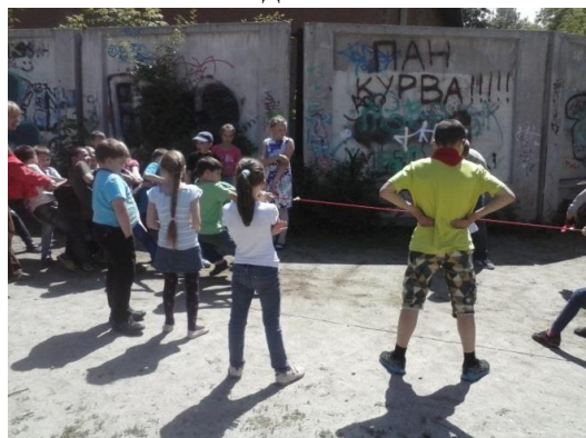
Ст. «Перетягиваем канат»