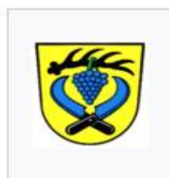
Strümpfelbach im Remstal

Вайнштадт появился как часть районной реформы 1 января 1975, в которой были объединены тогдашние независимые города Beutelsbach, Endersbach, Großheppach и Schnait.